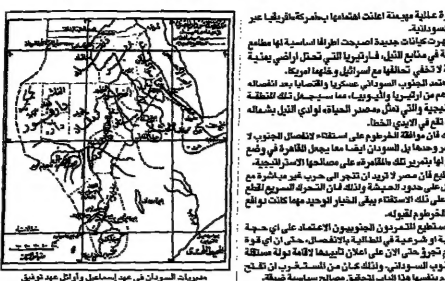
مخيمات السودان في عهد اسماعيل عبد الوهاب

عاشا ما اكتشفه الكثير بعد أن أجروا مسح على صحراء جيلفيما من السودان عام 1986 بعد ثلاثة عشر عاماً من التخلي عن الجنوب. وكان من نتائج المسح اكتشاف احتياطيات هائلة من البترول والغاز الطبيعي، مما يجعل السودان ثروة لا تحصى. وقد كشف المسح عن احتياطيات هائلة من البترول والغاز الطبيعي، مما يجعل السودان ثروة لا تحصى. وقد كشف المسح عن احتياطيات هائلة من البترول والغاز الطبيعي، مما يجعل السودان ثروة لا تحصى.